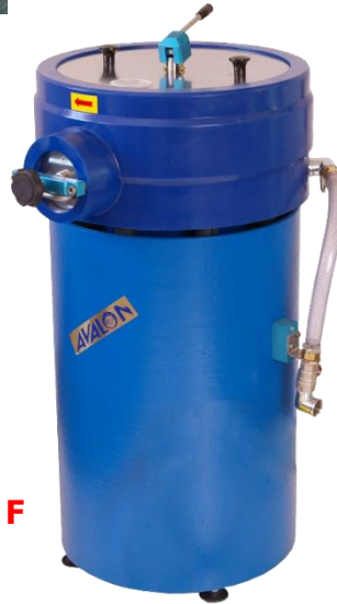
W 15 F