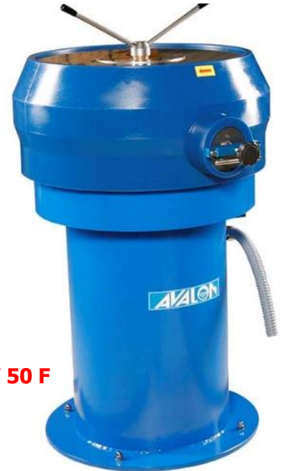
W 50 F

Великолепная галтовочная техника, не уступающая самым лучшим мировым образцам. Вибрационные машины AVALON отлично себя зарекомендовали и пользуются популярностью у ювелиров Польши, России, Франции, Финляндии, Норвегии, США, ... Простота устройства и эксплуатации, отличный дизайн, высокая прочность и безотказность. Предусмотрен полный набор необходимых в работе опций (приобретаются за отдельную плату).