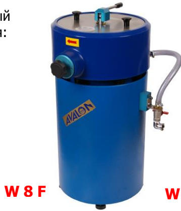
W 8 F