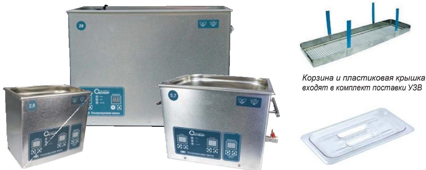
Корзина и пластиковая крышка входят в комплект поставки УЗВ